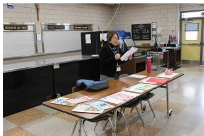
＜初等部入学説明会＞

お父さん、お母さんに手を引かれ、かわいい年少さんの子たちが、幼児部体験に集まってくれました。来年度年中さんになる子を対象に、実際の幼児部を体験してもらうことをねらいとしてこの教室を開催しました。幼児部さくら組の教室で、幼児部の先生が実際に指導にあたりました。「紙皿」を使ってでんでん太鼓(?)づくりをしまし自分の好みに合わせて、シールを貼って飾りつけをしたりしました。どの子も真剣な表情で飾り付けをしていました。中には名札にまで、シールを貼って活動を楽しむ子がいました。短い時間でしたが、幼児部の雰囲気を知ってもらうことができました。来年度の4月に本校に来るのを待っています。