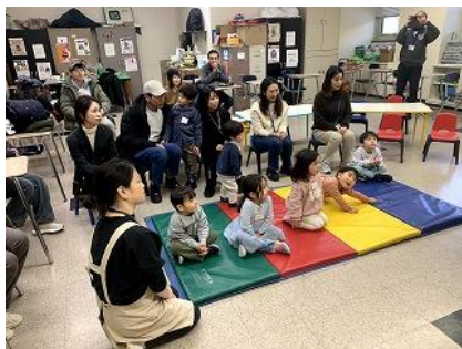
＜体験入学の様子＞た。

1月10日、幼児部で「もちつき体験」を実施いたしました。お釜を使ってもち米を蒸かすところから始まりました。炊きあがったもち米を見たり、順番に杵をもって餅つきを体験したりしました。もち米が次第に餅に変化していく様子を不思議そうに眺める子もたくさんおり、子供たちはとても感動していました。