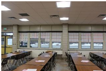
<硬筆コンクール作品展>